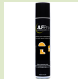
V322069-DD DESINFECTANT DESODORISANT